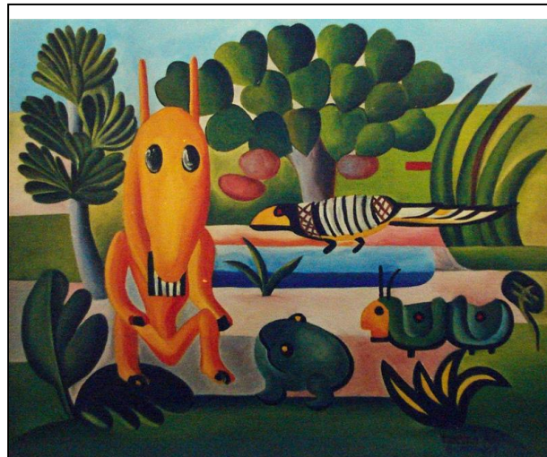
Figura 1: A CUCA - 1924 - TARCILA DO AMARAL

Questão 1 - A imagem abaixo é obra de Tarsila do Amaral. A artista brinca com as cores e com as representações dos animais tipicamente brasileiros. Essa obra é considerada precursora do tema da Antropofagia nas pinturas de Tarsila. Observando a imagem podemos perceber que a artista aplicou o uso das cores do círculo cromático. Podemos afirmar que ela usou uma cor com mais intensidade. Assinale com verdadeiro (V) ou falso (F) nas alternativas abaixo.